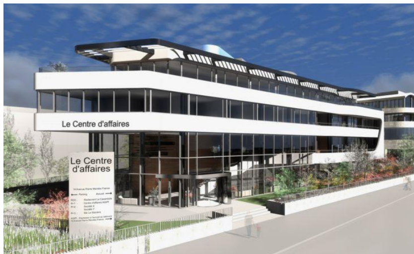
Détails significatifs explicatifs