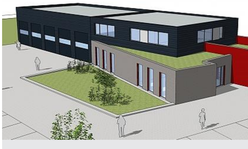
Détails significatifs explicatifs